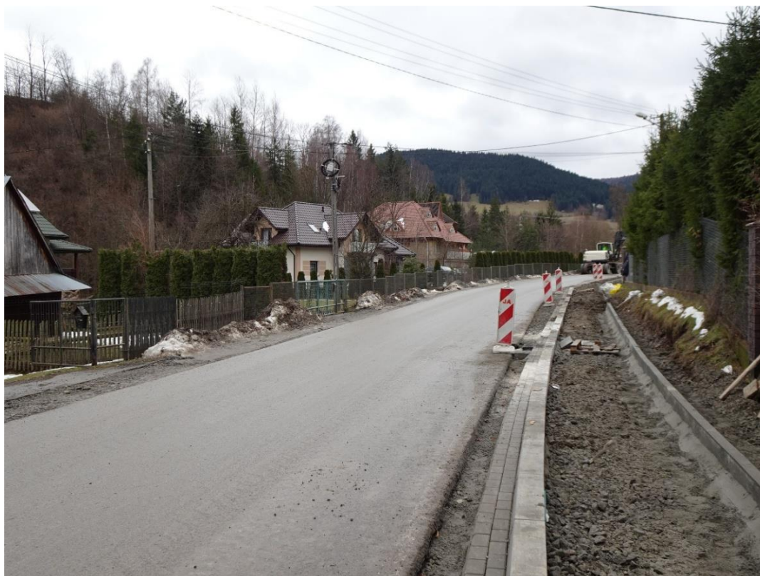
Gmina Mszana Dolna